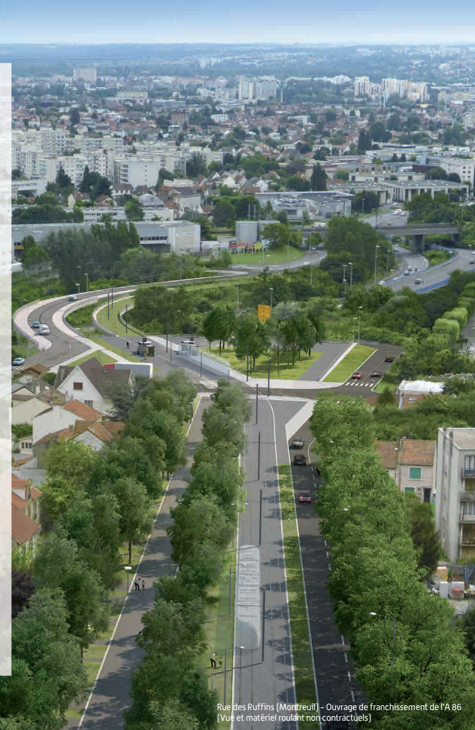
Rue des Ruffins (Montreuil) - Ouvrage de franchissement de l'A 86 [Vue et matériel roulant non contractuels]