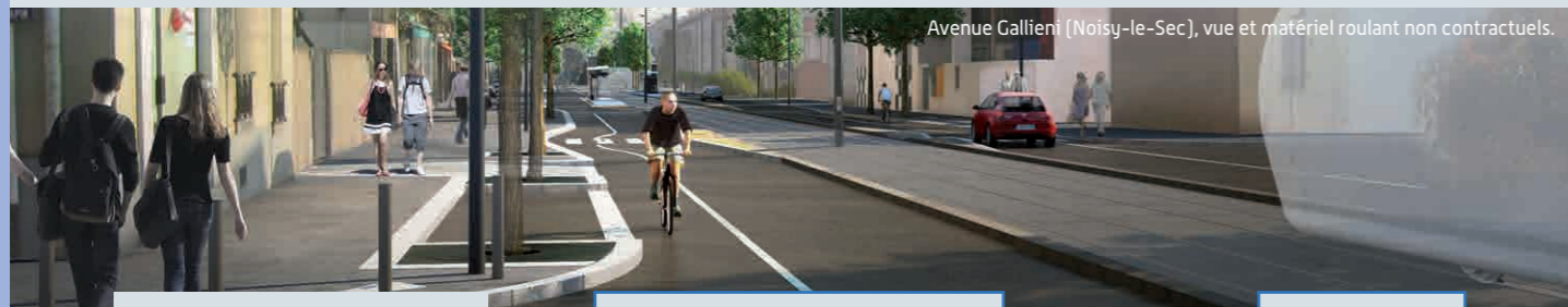
Avenue Gallieni (Noisy-le-Sec), vue et matériel roulant non contractuels.

La RATP aura en charge l'ensemble du système de transport (réalisation de la plate-forme, des stations et du site de maintenance et de remisage des rames), la réalisation du double-terminus à Bobigny – Pablo-Picasso et l'ouvrage de franchissement de l'autoroute A86. Le Département de la Seine-Saint-Denis, auquel le Département du Val-de-Marne a délégué sa maîtrise d'ouvrage, sera en charge du réaménagement des espaces publics le long du tramway et des opérations de franchissement de l'A3 ; il coordonnera également l'ensemble des travaux.