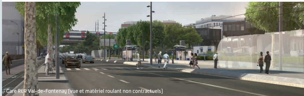
Gare RER Val-de-Fontenay (vue et matériel roulant non contractuels)

Concernant l'aménagement d'un chemin piéton entre l'actuel pôle RER et le futur terminus du T1 à Val de Fontenay : les maîtres d'ouvrage se sont engagés à améliorer la liaison piétonne en assurant un accès confortable et sécurisé entre le RER A et E de Val de Fontenay.