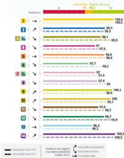
Offre aux heures de pointe