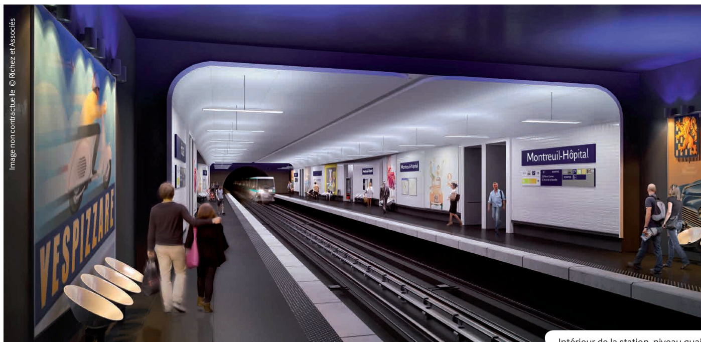
Intérieur de la station, niveau quai.

S'insérant sous le boulevard de la Boissière, la station Montreuil-Hôpital se situe à la limite des communes de Noisy-le-Sec et Montreuil, entre une vaste zone pavillonnaire au nord et le Centre Hospitalier Intercommunal André Grégoire au sud. Cette station permet d'apporter une meilleure accessibilité à l'hôpital, notamment pour les visiteurs.